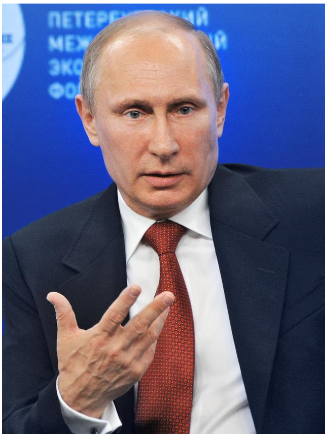
Президент России В.В. Путин

Указ Президента РФ от 7 мая 2024 года №309 «О национальных целях развития Российской Федерации на период до 2030 года и на перспективу до 2036 года»